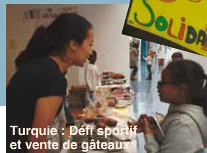
Turquie : Défi sportif et vente de gâteaux