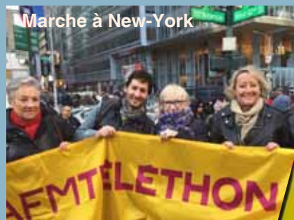
Marche à New-York