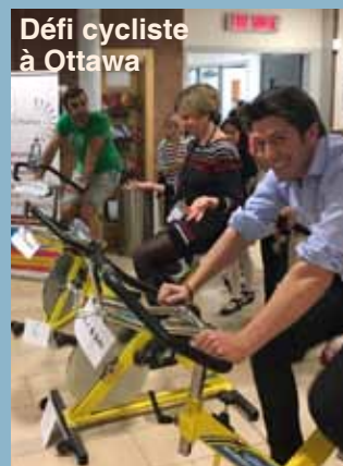
Défi cycliste à Ottawa