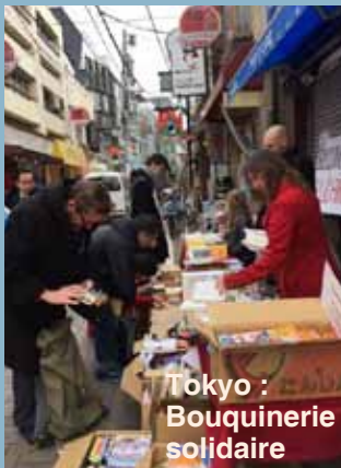
Tokyo : Bouquinerie solidaire