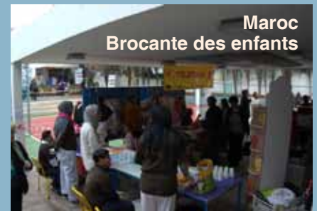
Maroc Brocante des enfants