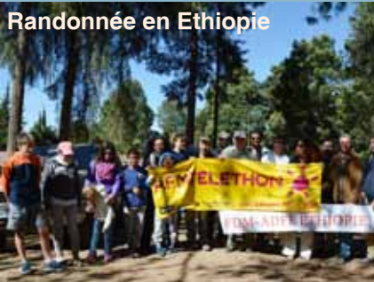
Randonnée en Ethiopie