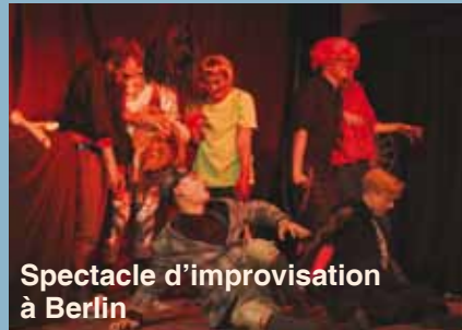
Spectacle d'improvisation à Berlin